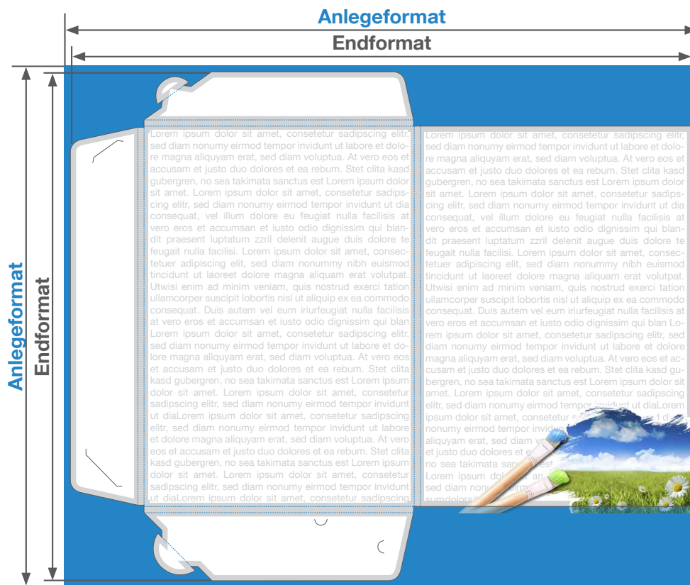
Zeichnung nicht maßstabsgetreu

Anlege- und Endformat: Je nach Füllhöhe. Siehe Vorlagen.